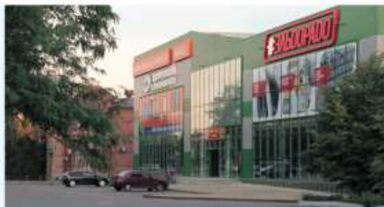
ТЦ «НОВОШАХТИНСК MALL»