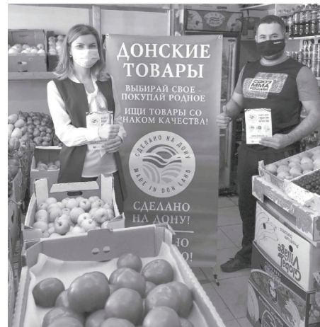
В наших торговых объектах популяризируют бренд «Сделано на Дону»

- Торговый оборот в значительной степени зависит от покупательской способности населения. Что показывают нам итоги 2021 года в плане заработной платы новошахтинцев?