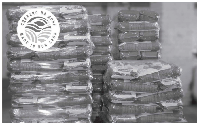
Продукция ООО «Успех» прошла сертификацию «Сделано на Дону»