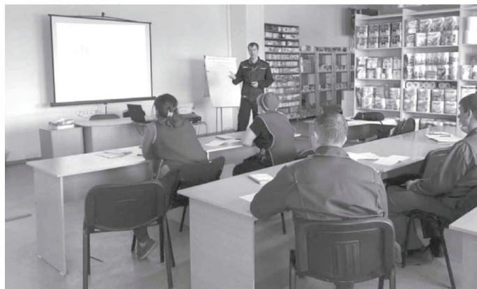
На ООО «Лилия» реализуют нацпроект «Производительность труда»