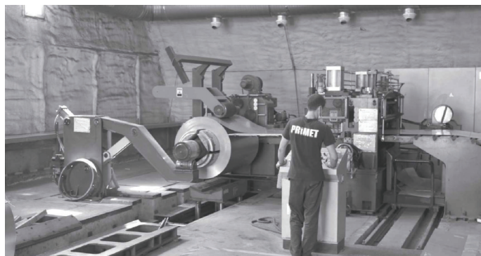
На ООО «Ю-Мет» внедрено бережливое производство

Ситуация на рынке труда стабилизировалась, более того, вновь обострилась проблема, с которой мы уже сталкивались до пандемии, — на предпри-