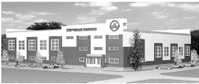
Так будет выглядеть новый спорткомплекс.

курсе «Информационное партнёрство: власть - общество - СМИ», в номинации «Стратегия развития». Это всё подтверждает, что мы приняли важный и качественный документ, который определяет перспективы нашего города. Мы уже год живём по принятой «Стратегии» и можно с уверенностью сказать, что намеченные планы претворяются в жизнь.