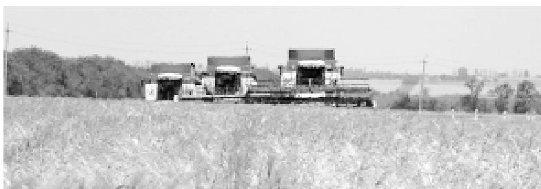
В этом году на полях Дона собрали более 7 млн тонн зерна.