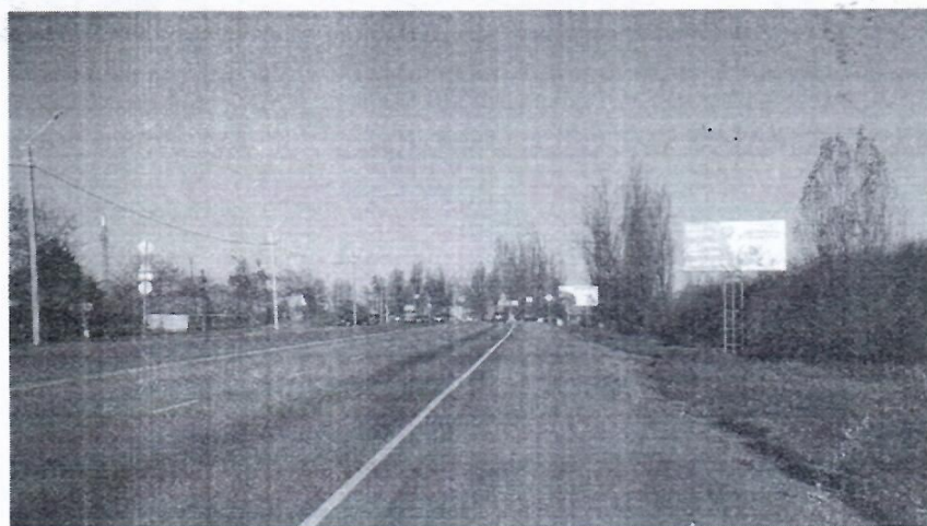
Эскиз рекламной конструкции